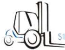
Lastdiagramm (EN1459-B) :