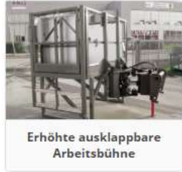
Erhöhte ausklappbare Arbeitsbühne