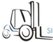
Lastdiagramm (EN1459-B) :