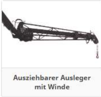
Ausziehbarer Ausleger mit Winde