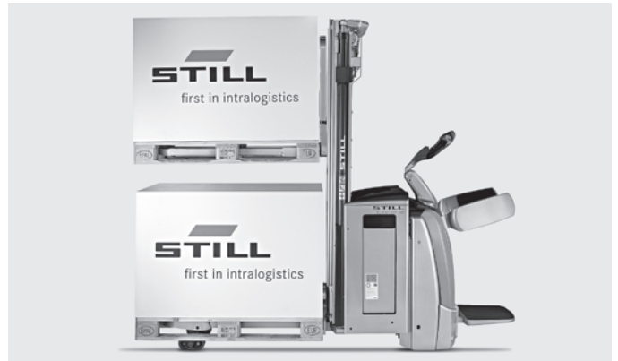
Hohe Umschlagleistung dank Transport zweier nicht stapelfähiger Ladungsträger