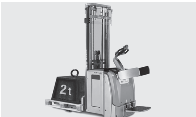
Maximale Kraft: Wird der Masthub nicht benötigt, lassen sich bis zu 2,0 t auf dem Initialhub transportieren