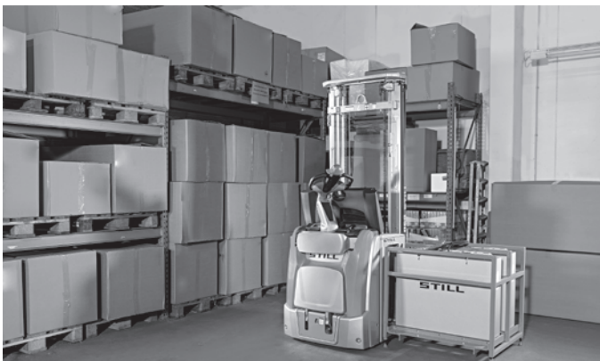
Jederzeit einsatzbereit: Hohe Verfügbarkeit dank des optionalen seitlichen Batteriewechsels