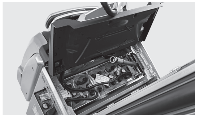
Schnell und sicher: Die innovative Batterieverriegelung ermöglicht einen schnellen Wechsel der Batterie ohne Klemmrisiko