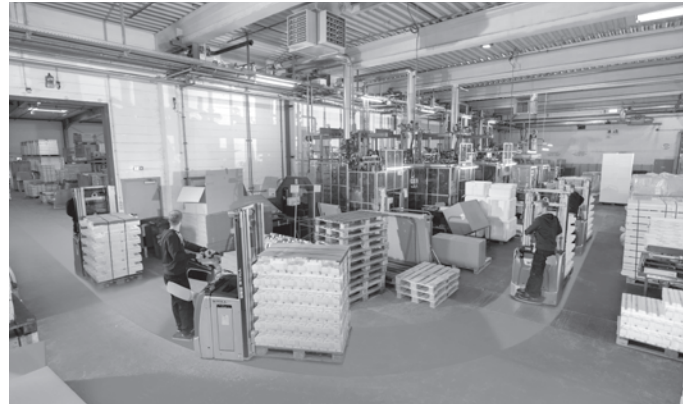
Auch in Kurven sicher unterwegs: Automatische Geschwindigkeitsreduzierung in Kurven