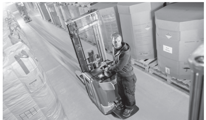
Höchste Umschlagleistung: Fahrgeschwindigkeit von bis zu 10 km/h