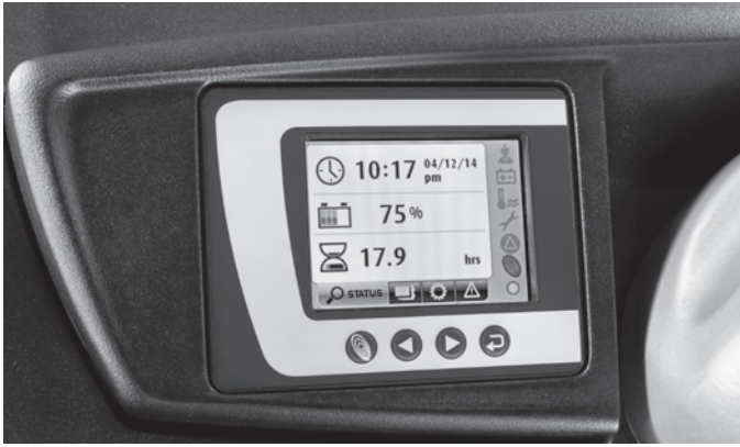
Immer alles im Blick: Farbdisplay mit vielen sprachunabhängigen Symbolen zeigt alle wichtigen Funktionen auf einen Blick