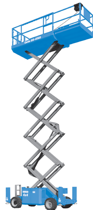
Abb. nur zu Illustrationszwecken. CE Maschinen sind mit Scherenschutz-Paket ausgestattet.