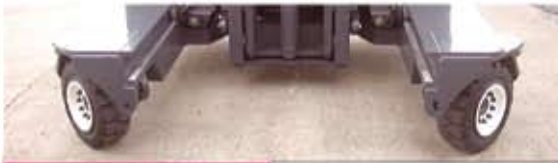
Drehen auf der Stelle