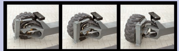
Das 4-Wegesystem transformiert den Mitnahmegabelstapler zu einem fortschrittlichen Seitenlader.