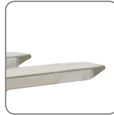
Geschlossene Gabel bedeutet einfache Reinigung und wenige Bakterienverstecke.