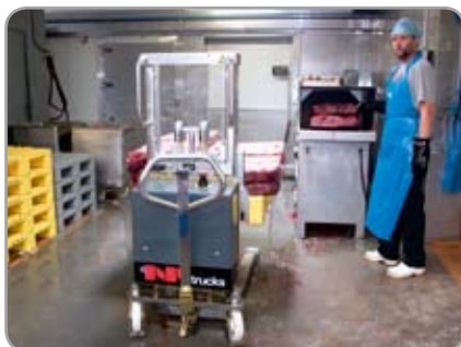
Für die Lebensmittel- und Pharmaindustrie, in denen Paletten in hygienischen Umgebungen zu handeln sind.