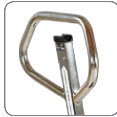
Die ergonomische Deichsel gewährt dem Anwender einen entspannten Griff.

Mit manuellem und elektrischem Hub erhältlich.