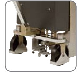
EHS 1000 RF-SEMI mit rostfreier Kettensteuerung der beiden Lenkräder. Einfacher und hygienischer Betrieb.