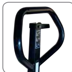
Die ergonomische Deichsel gewährt einen entspannten Griff.