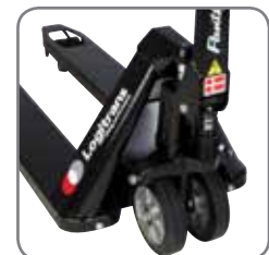
Panther Silent hat permanenten Schnellhub.

Gerne bieten wir Ihnen auch kundenspezifische Lösungen an. Besuchen Sie auch www.logitrans.com