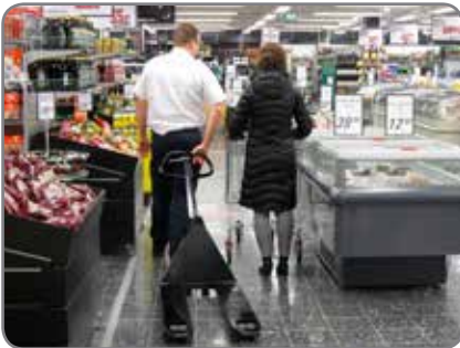
Panther Silent in einem Supermarkt, wo Komfort und Wohlbefinden der Kunden von großer Bedeutung sind.