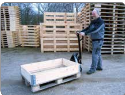
Transport von Gütern im Freien auf losen Untergrund! Mit unserem Panther Silent kein Problem.