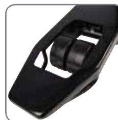
Die Zwillingsgabelrollen sichern optimale Drehbewegungen.