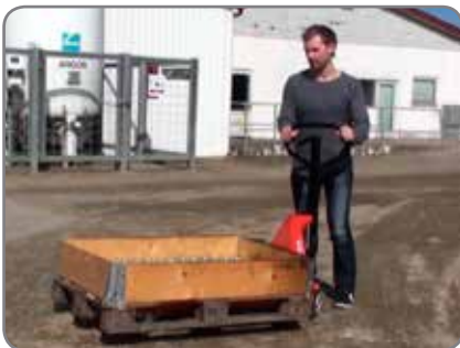
Transport von Gütern im Freien auf losen Untergrund! Mit unserem Panther Silent kein Problem.