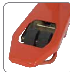
Die Zwillingsgabelrollen sichern optimale Drehbewegungen.