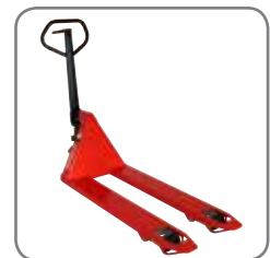
Panther Silent hat permanenten Schnellhub.

Gerne bieten wir Ihnen auch kundenspezifische Lösungen an. Besuchen Sie auch www.logitrans.com