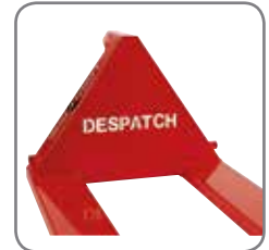
Firmennamen bzw. Logo des Kunden können im Dreieck des Wagens ausgeschnitten werden.