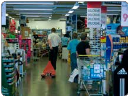
Panther Silent in einem Supermarkt, wo Komfort und Wohlbefinden der Kunden von großer Bedeutung sind.