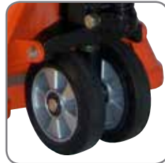
Spezielle Gummiräder schonen empfindliche Bodenbeläge und haben hervorragende anti-statische Eigenschaften.