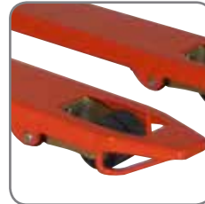
Gleitbügel an den Gabelspitzen ermöglichen ein einfaches und leichtes Hinein- und Herausfahren aus Paletten.