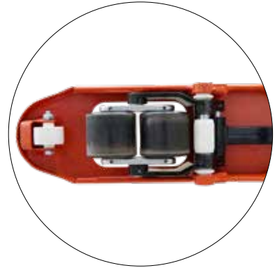
Ein- und Ausfuhrrollen