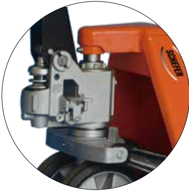
Hochleistungs-Hydraulikpumpe mit Zentralverschluss