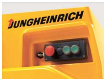
Rücktasteinrichtung für komfortables An-/Abkuppeln