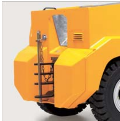
Mehrfachsteckkupplung für verschiedene Deichselhöhen der Anhänger