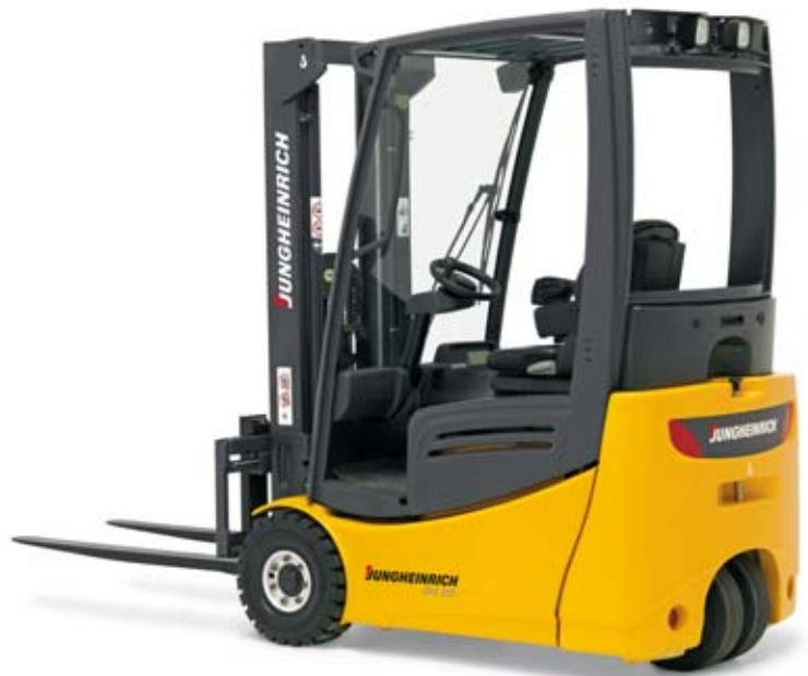
Abbildung mit Zusatzausstattungen

5 individuell einstellbare Arbeitsprogramme